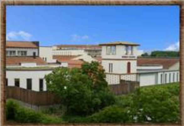
Blick vom Balkon auf die Römersauna der Limes-Therme